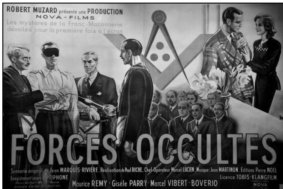
Kleuraffiche van de film 'Forces Occultes' uit 1942

De hardnekkig in het leven gehouden mythe luidt dat nogal wat Duitse BB., ook lang na deze inzamelactie, het Myosotisspeldje bleven dragen ter vervanging van het intussen door de nazi's verboden passer-en-winkelhaaksymbool. En als herinnering aan de hoogdagen van de Grossloge zur Sonne . Dat is echter hoogst onwaarschijnlijk gezien de tijdsgeest. Meer nog: om een ontbinding van de loges door de nationaalsocialisten voor te zijn, had de Grossloge zich al in 1933 ontbonden en alle Werkplaatsen gesommeerd de Lichten te doven . Ingevolge de Rijksverordening van 28 maart 1935 waren tegen september 1936 ook alle aanverwante verenigingen officieel ontbonden