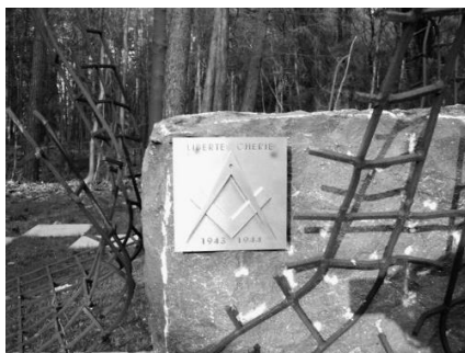
Gedenkmomument aan de L. liberté Chérie in het kamp Esterwegen

Op 13 november 2004 werd op initiatief van de Belgische V.:M.: een monument in Esterwegen onthuld ter nagedachtenis aan dat exceptionele gebeuren. Dit in aanwezigheid van zeven Grootmeesters en honderden BB.: Het beeldhouwwerk werd door architect Jean de Salle ontworpen als een deels ruwe, deels kubieke granieten steen, waarop Passer en Winkelhaak zijn aangebracht. De steen doorklieft een metalen rasterwerk, symbool van het verzet tegen de fysieke, mentale en spirituele onderdrukking van de mens tijdens het Naziregime. Het geheel rust op een zwart/wit geblokte vloer. 17