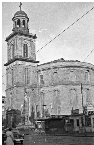
De Paulskirche in Frankfurt in 1947 en ca 1950 na de heropbouw