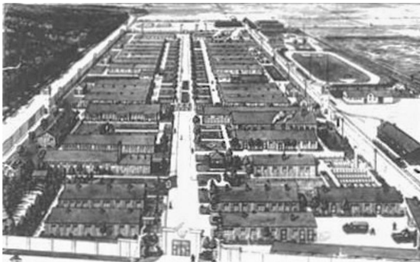
Lager VII Esterwegen ca. 1945

Drie speciaal daartoe uitgeruste Nacht und Nebel -concentratiekampen waren: Natzweiler-Struthof in de Elzas, Groß-Rosen in Silezië, en Lager VII Esterwegen, dat op zich 25 kilometer van de grens met de Nederlandse provincie Groningen bevond.